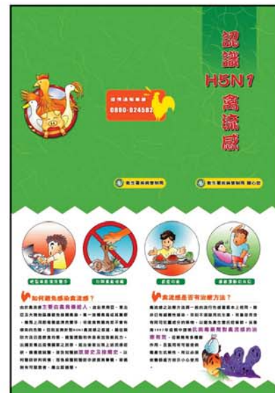
Φυλλάδιο που κυκλοφόρησε σε ασιατική χώρα, για την ενημέρωση των πολιτών